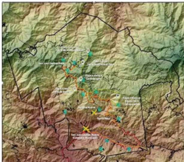
Figura 2 El trayecto de San Juan Lachao Nuevo a Santa María Rancho Nuevo (cartografía).

dicha población no cuenta con una tesis que dé cuenta de estos estas agrupaciones musicales cuyas prácticas desarrollan procesos dinámicos y significativos los cuales son vitales para para el mantenimiento, revitalización y preservación de la cultura musical de la región.