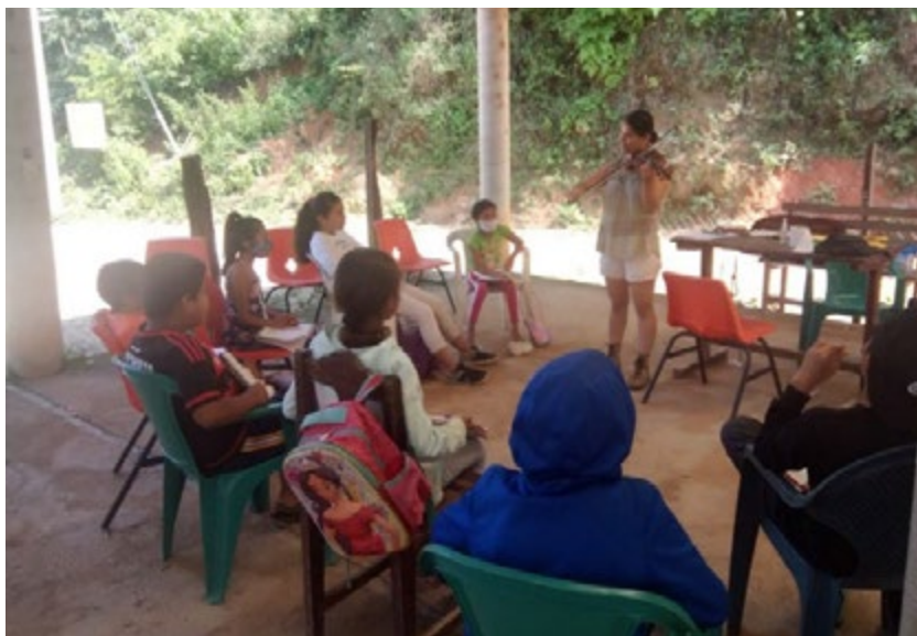
Figura 4 Concierto didáctico a los niños y niñas de la próxima banda de viento de Santa María Rancho Nuevo.

Las indicaciones que me dieron para entrar a la comunidad fue la de utilizar cubrebocas y mantener una sana distancia con los niños en todo momento, ya que la comunidad es pequeña y se encuentra aislada. Después se procedió a conocer la galera de usos múltiples de la comunidad, pues en ese lugar se imparten las clases de música. Para la presentación con los niños se realizó un pequeño concierto didáctico de violín (véase figura 4) dada mi condición de profesora en dicho instrumento, intentando ajustarme a lo que señala Taylor y Bogdan (1992) sobre la entrada al campo de modo gradual, de manera sencilla para que poco a poco los informantes (en este caso los niños y niñas) tomen confianza al investigador y se puedan adaptar a verlo regularmente en sus espacios de estudio. De este modo, se mantuvo una atmosfera inicial de confianza e interés por los instrumentos musicales de cuerdas frotadas en este caso, a diferencia de los instrumentos más comunes que se tocan en la comunidad, los instrumentos de viento. Además, se realizaron otras actividades lúdicas relacionadas con la música durante diferentes sesiones.